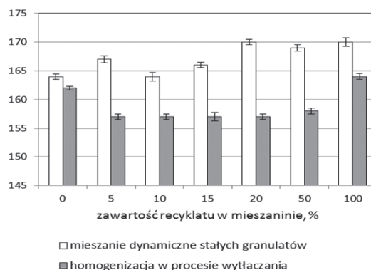
Rys. 3. Zależność współczynnika rozszerzenia strugi ( \beta ) od zawartości recyklatu w mieszaninie, przy obciążeniu tłoka plastometru 2,16 kg – 1,97 kPa

zachodzi dla dodatku recyklatu w ilości 20 i 50%; jednakże wartości te porównywalne są do rozszerzenia strugi wypływającego recyklatu. W przypadku mieszanin wytworzonych w procesie wytłaczania obserwuje się spadek wartości \beta , w stosunku do PE-LD, wraz ze wzrostem zawartości recyklatu w mieszaninie.